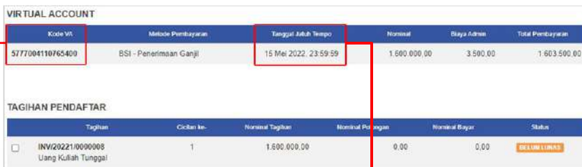
Tampilan Komputer/ Laptop

4. Kode Virtual Account (VA) sudah berhasil digenerate. Status “Tagihan Pendaftar” otomatis “LUNAS” setelah pembayaran Uang Kuliah Tunggal (UKT).