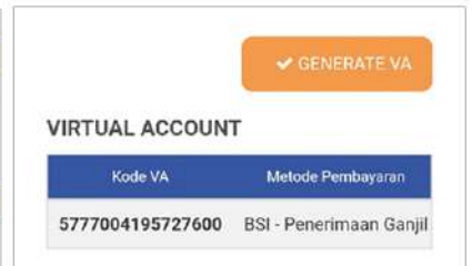
Tampilan Smartphone/ HP

Kode VA tersebut digunakan untuk pembayaran UKT melalui Teller BSI atau BSI Mobile