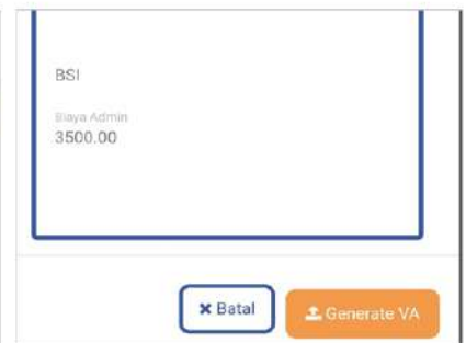
Tampilan Smartphone/ HP

4. Kode Virtual Account (VA) sudah berhasil digenerate. Status “Tagihan Pendaftar” otomatis “LUNAS” setelah pembayaran Uang Kuliah Tunggal (UKT).