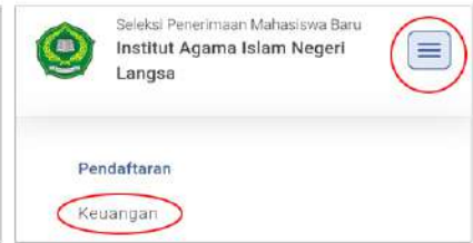
Tampilan Smartphone/ HP

2. Apabila “Tagihan Pendaftar” sudah muncul, centang TAGIHAN dan Klik “GENERATE VA”