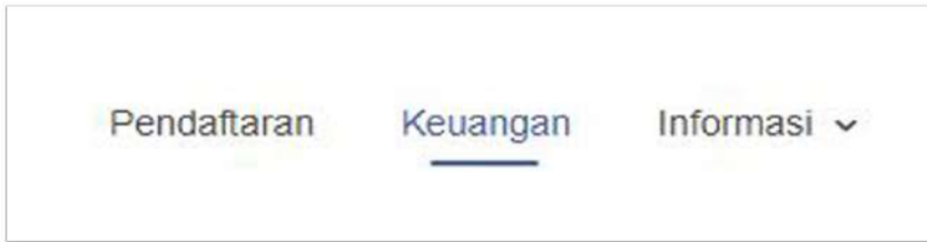
Tampilan Komputer/ Laptop

1. Calon Mahasiswa login ke https://pmb.iainlangsa.ac.id/login dan masuk ke menu “Keuangan”